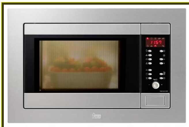
MICROONDAS + GRILL TMW 20.2 BIS