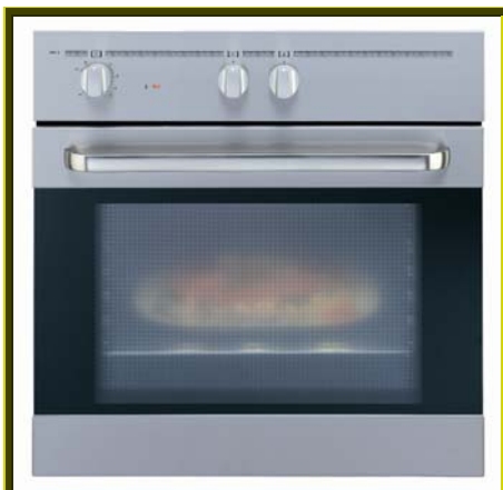
HORNO HI 615