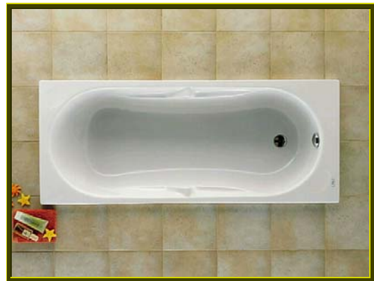
BAÑERA ACRILICA MODELO GENOVA