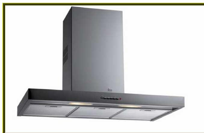
CAMPANA EXTRACTORA DECORATIVA DH 70