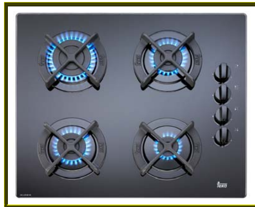
ENCIMERA CRISTALGLAS CG LUX 60 4G