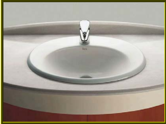
LAVABO MODELO JAVA