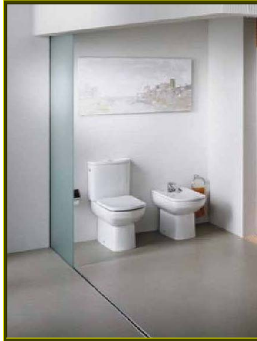
DAMA SENSO COMPACTO