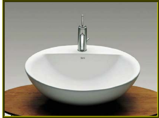
LAVABO MODELO FONTANA