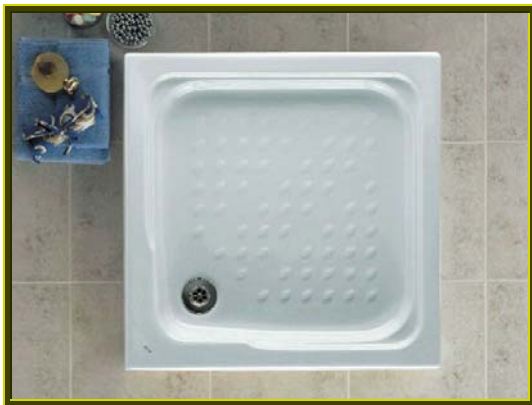
PLATO DE DUCHA MODELO MALTA CUADRADO