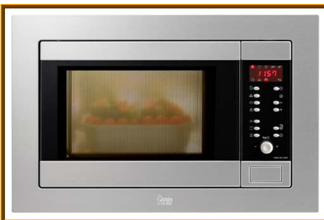
MICROONDAS + GRILL TMW 20.2 BIS