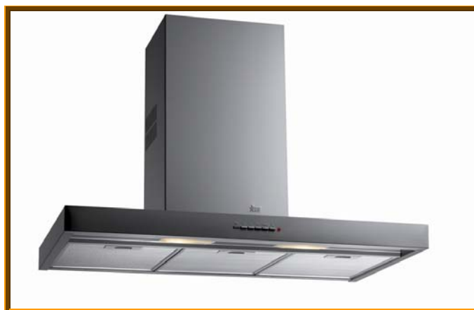
CAMPANA EXTRACTORA DECORATIVA DH 70