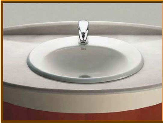
LAVABO MODELO JAVA