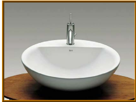
LAVABO MODELO FONTANA