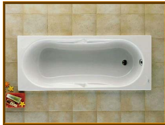
BAÑERA ACRILICA MODELO GENOVA